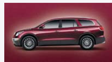
Rojo oscuro metálico