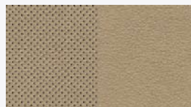
Piel perforada cashmere