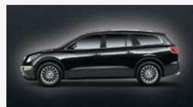
Negro grafito metálico