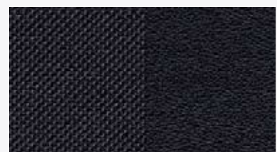
Piel perforada negra